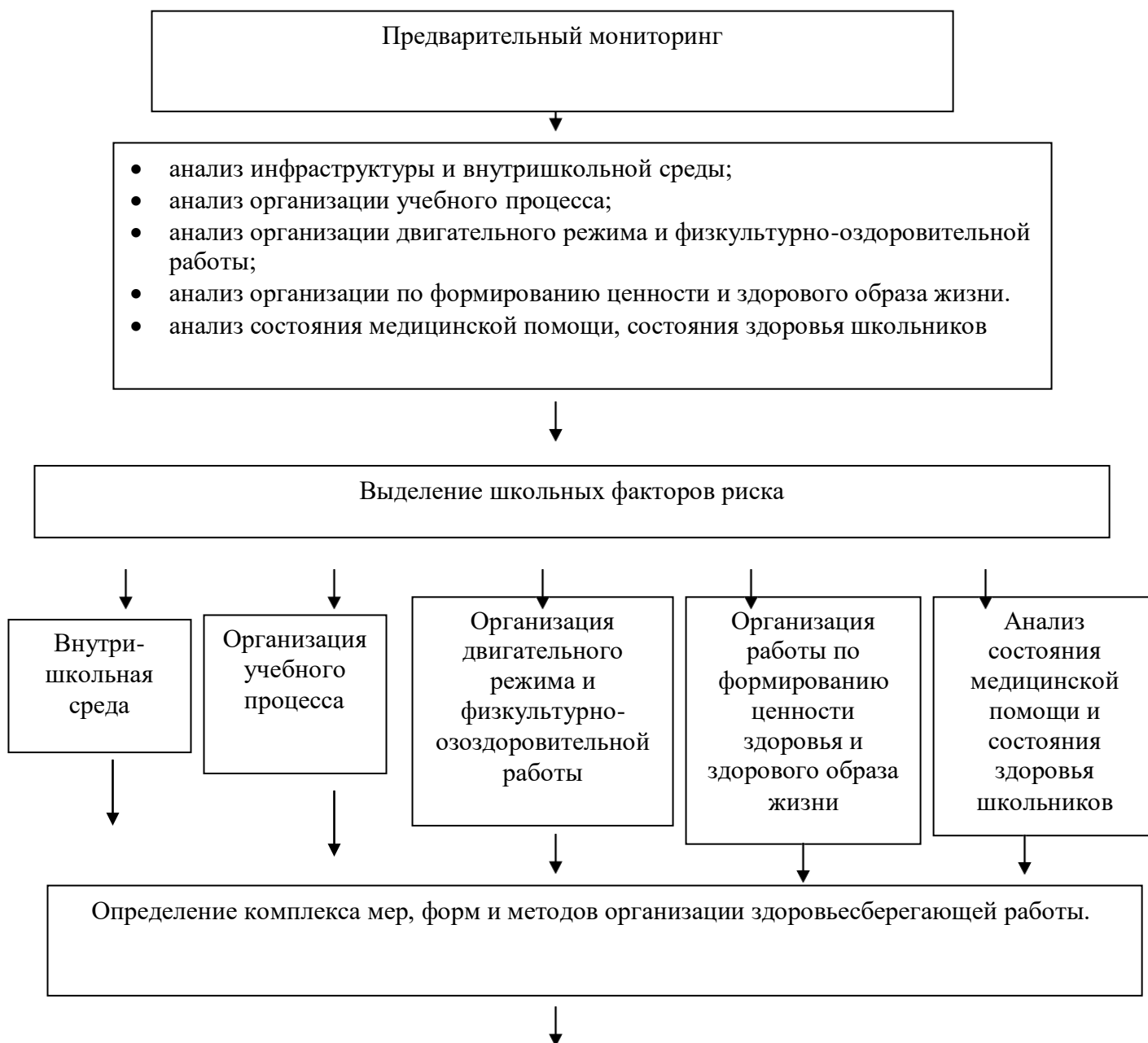
Схема мониторинга здоровьесберегающей работы в школе.

Реализуются образовательные программы, направленные на формирование сознательного отношения к своему здоровью, профилактику вредных привычек, асоциального поведения, пропаганду здорового образа жизни. Программы: «Спорт и здоровье», «Профилактики злоупотребления наркотиками и другими психоактивными веществами среди подростков и молодёжи».