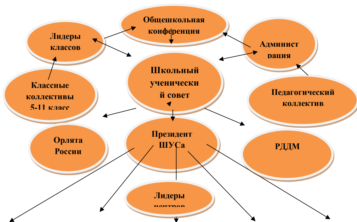
Модель ученического самоуправления школы.